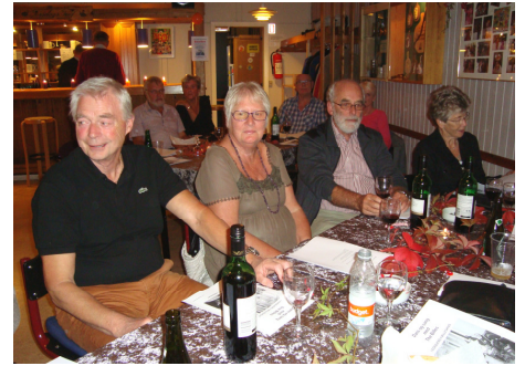
Egebjergklubben og Fælleshuset et vigtigt samlingssted.

Fællesskabet i Egebjerg har altid haft høj prioritet, og derfor er