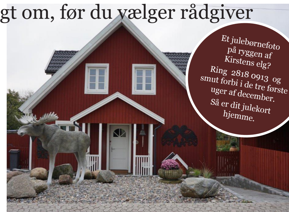
Det nye hus på Pæremosevej 9

Rådgiveren har fået mange penge, da han bare kunne skrive sine egne regninger i starten, men flere af de