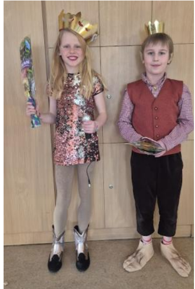
Konge og dronning, mellemste tønde, fastelavn klokken 15