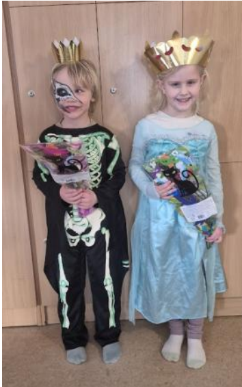
Konge og dronning, lille tønde, fastelavn klokken 15