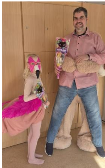
Konge og dronning, voksen-tønde, faste- lav kl. klokken 12