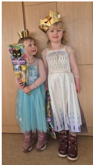
Konge og dronning, den mellemste tønde, fastelavn klokken 12: