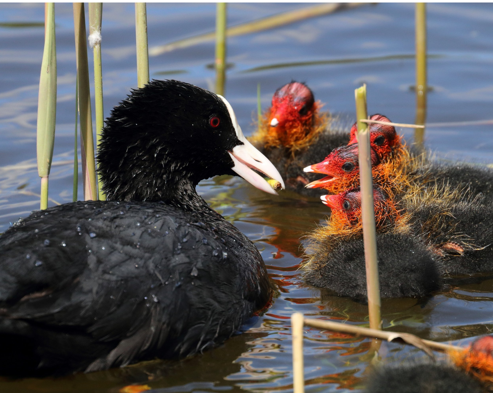
Blishøneællinger og deres mor fotograferet af én af Egebjergbladet læsere.